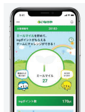
ホーム画面イメージ

参加いただくには、「いなげやミールマイルプログラム」公式アプリのダウンロードが必要となります。