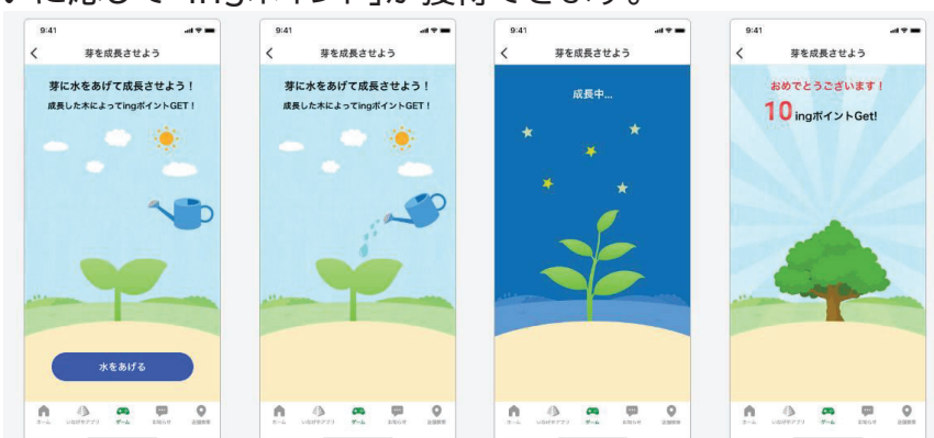
ゲーム画面イメージ

30ミールマイルを貯めると、ゲームを1回プレイできます。水をあげて芽を成長させると、木の成長度合いに応じて「ingポイント」が獲得できます。